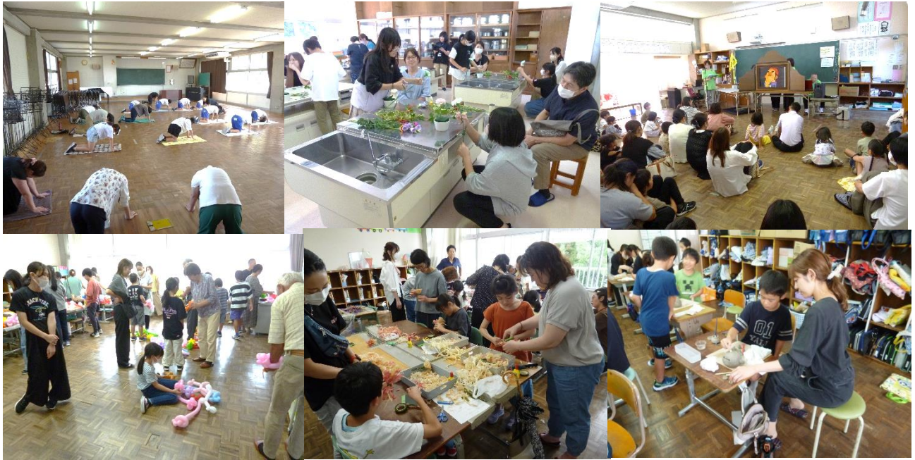
全ての講座の写真を紹介できず済みません